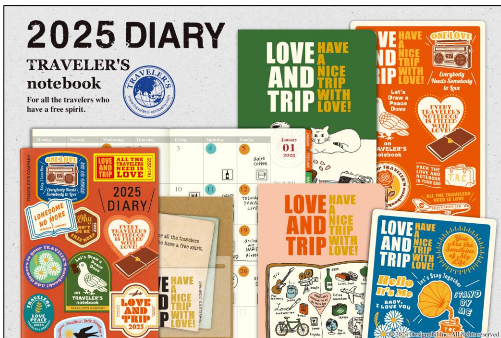
2025年のテーマは「LOVE AND TRIP」 愛が詰まったトラベラーズノートとともに良い旅を！

使い手の深い愛が込められ、いつも大切に使われている『トラベラーズノート』。ノートを見せ合うことで、旅先で話が弾み、性別も年齢も国籍も飛び越えて理解し合えることがあるかもしれません。たくさんの人が旅をし、出会った誰かと好きなことを語り合い、世界中で愛を伴った温かく親密なつながりが生まれたり、世界は今より楽しく平和になるのかも…。そんな思いを込めてデザインをしました。