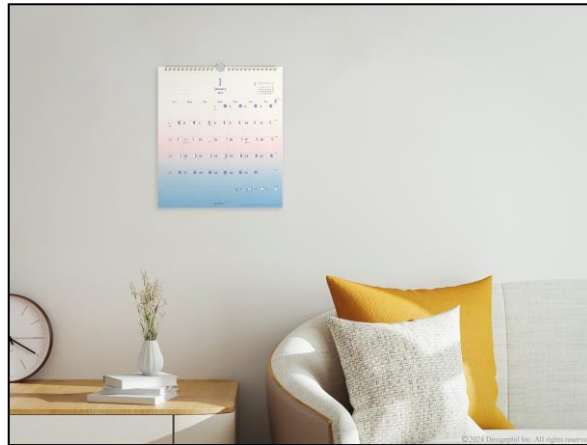
インテリアに馴染む優しい雰囲気