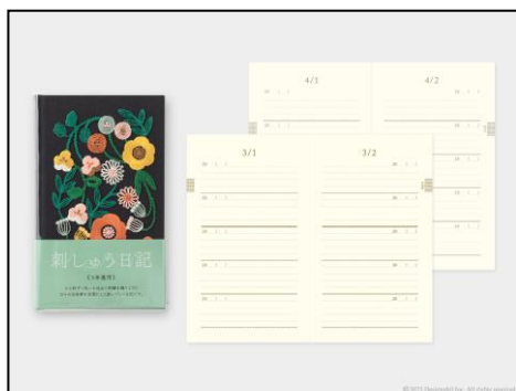
表紙のベースカラーに 深みのある黒が登場