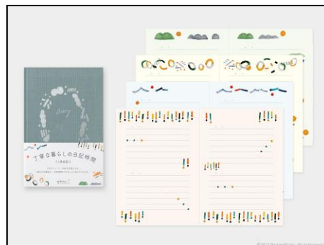
ページをめくる度に新しい気持ちで 日々を綴ることができる筆記面