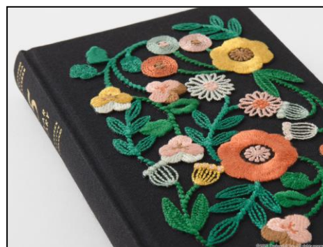
思わず触れたくなる 繊細な質感や立体感が魅力