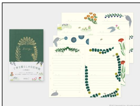
柔らかな布貼りの表紙と 風合いのあるデザインが魅力