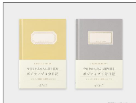
黄色とグレーの2色展開