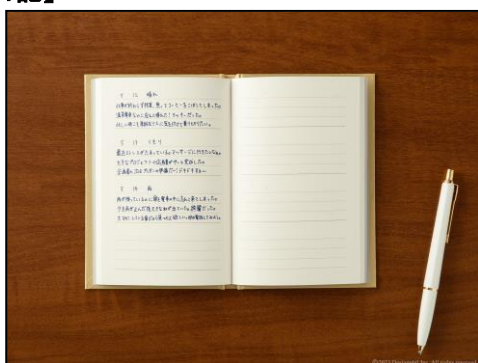
3分でかんたんに振り返る、 1日3行の新フォーマット