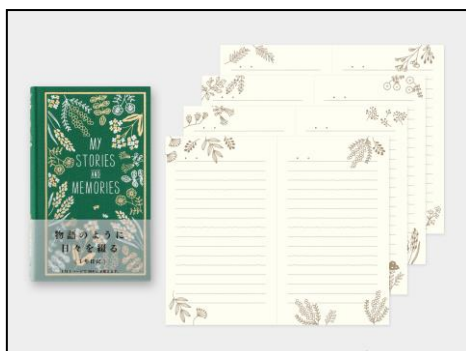
野に咲く愛らしい花々を箔でデザインした 新柄が仲間入り