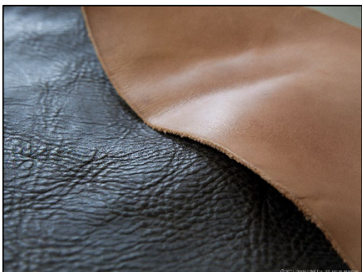
使うほどにツヤと深みが増す ホワイトワックスシュリンクレザー(左)と ナチュラルタンレザー(右)

製品に関する詳しい情報は、オフィシャルホームページ( www.knox-japan.jp )にて公開いたします。(2023 年 9 月 4 日(月)予定) (※)全て希望小売価格