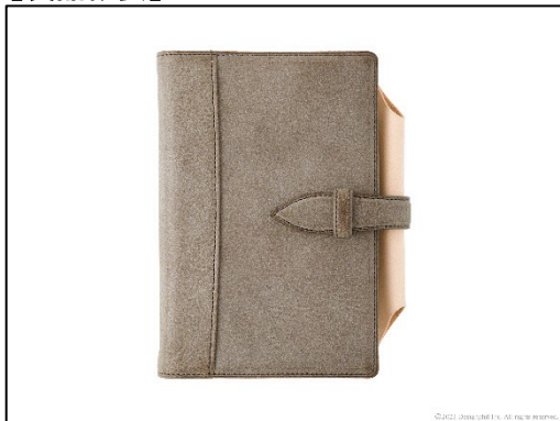
「ピラス」の美しい曲線と切り替えデザインを踏襲