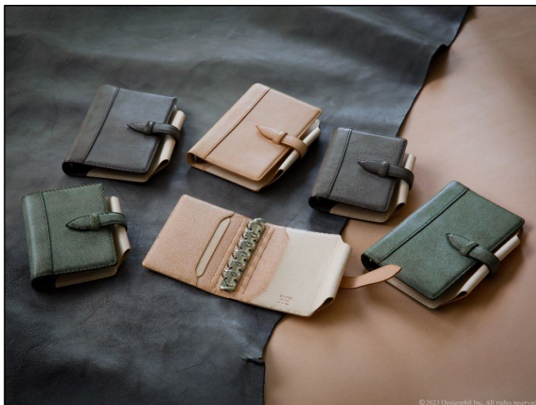
手帳の継承と進化に挑む 次の世代の新定番「N/PEARCE(エヌ/ピアス)」新登場