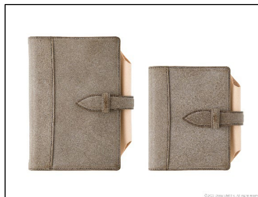
バイブルサイズとミニサイズの 2 サイズ展開