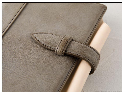
リフィルに干渉せず、太めの万年筆も包み込む 外向きペンホルダー