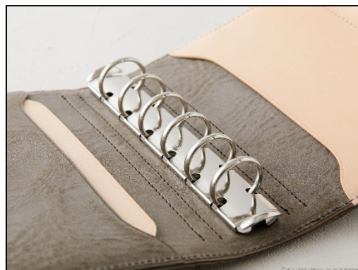
リフィルがたっぷり収納できる 20mm 径のリング