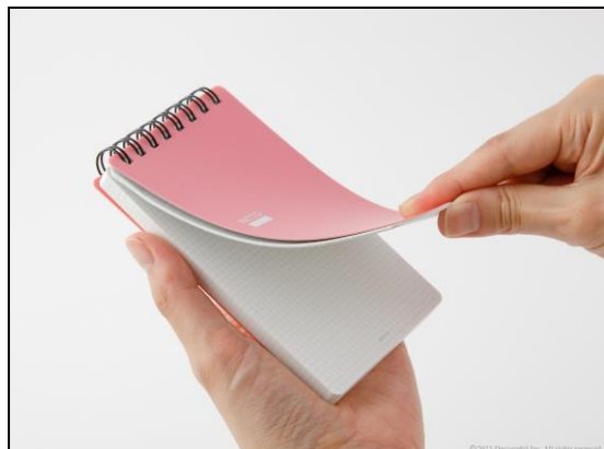
使いたいときに、さっと新しいページが開く