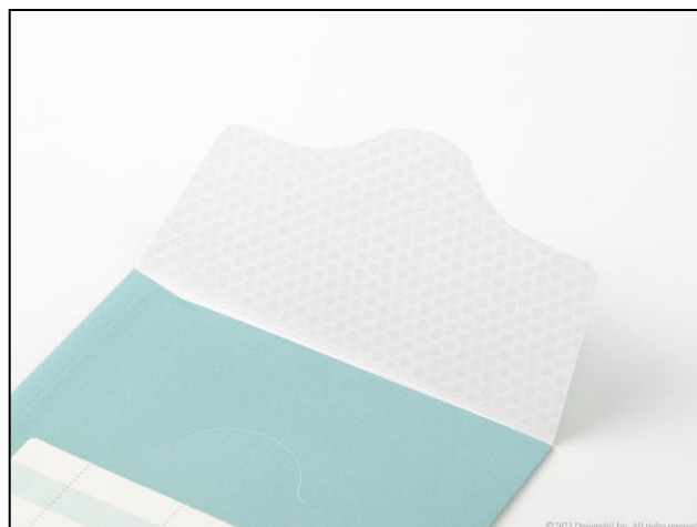
フタ部分は差し込み式で中身が落ちにくく、樹脂コーティングで抜き差しがしやすい