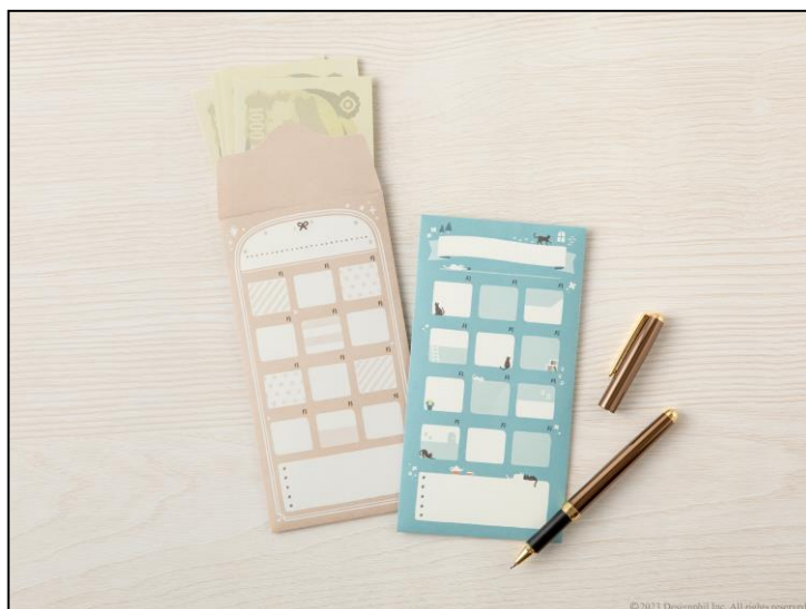
楽しくお金が貯められる！これまでにない貯金のための封筒 『貯金封筒』新発売

12ヵ月タイプとリストタイプ、いずれも、ご自身で決めたルールや意気込みを書き込むスペースを設けました。また、記入スペースに書き切れなかったルールやその他のお金の記録は、裏面に書き込むことができます。