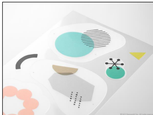
部屋の雰囲気に馴染むよう 光沢を抑えたマットな質感