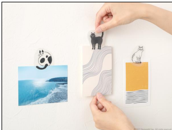
壁を傷めない再剥離タイプで安心