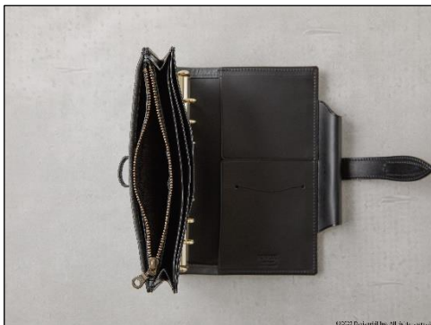
マルチなジッパーポケット付属