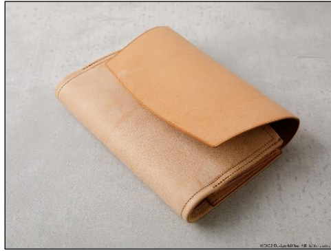
手帳全体を包み込むフラップ付タイプ