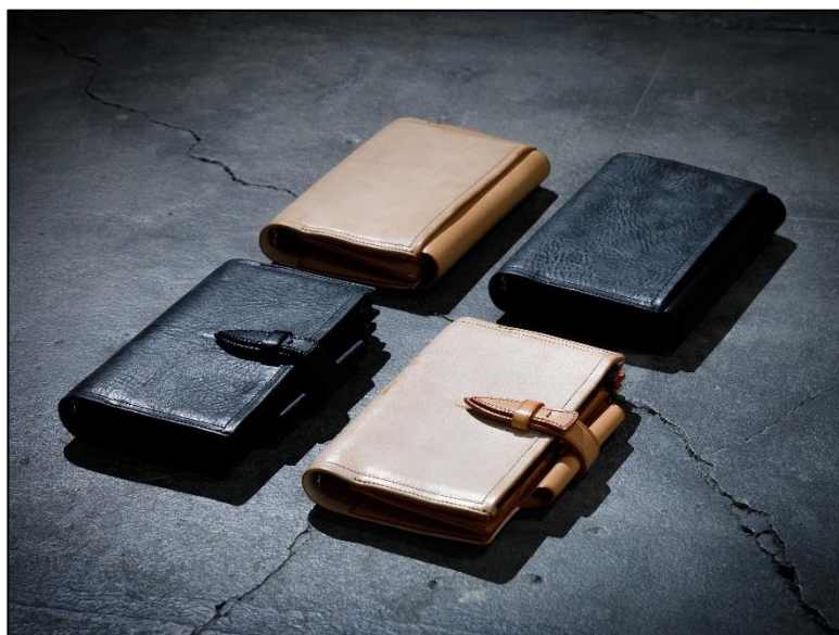
AUTHEN に次ぐ KNOX セカンドフラグシップモデル 新たなストーリーを紡ぎ出す新シリーズ「FLUCT」(フラクト)登場！

卓越した職人技と精神性が可能にする唯一無二のハンドメイドで、全ての工程を作り上げ、至福の手帳時間をカタチにしました。