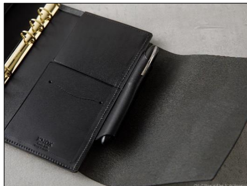
包み込むような大判差し込みフラップ

製品情報に関する詳しい情報は、オフィシャルホームページ( www.knox-japan.jp )にて公開いたします。また、公式 YouTube チャンネル( https://www.youtube.com/channel/UCIYJeC4s4eEyCj_GQCxDCYQ )で動画をご覧ください。 (10月5日(水)公開予定)