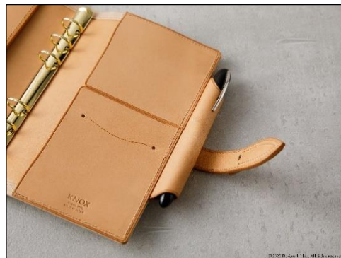
さまざまな太さ、長さの筆記具に対応した ペンホルダーのカットライン