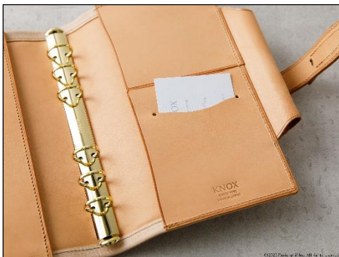
革小物(財布)職人ならではの 使いやすいポケット