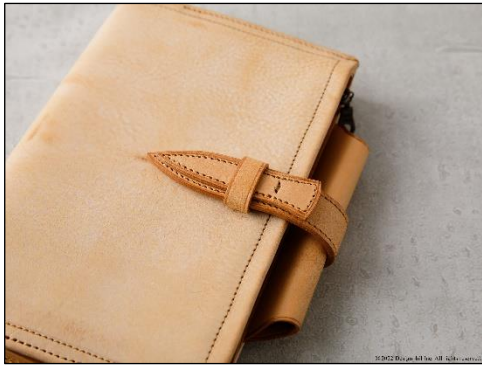
ベルト付タイプ 丈夫で使いやすい剣先ベルト