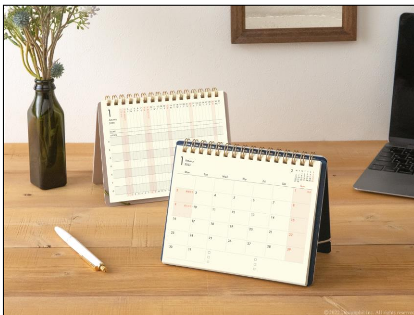
省スペースで快適なワークスタイルをサポート！デスクに立てられる 2023 年版『プラススタンドダイアリー』発売