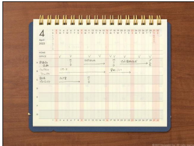
月間ブロックを裏返すと、複数案件の進行に便利なプロジェクトページに早変わり