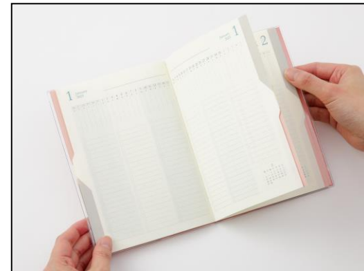
グレー(ToDo)のインデックスを押さえると グレーのページのみが開く