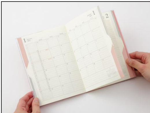
赤(月間ページ)のインデックスを押さえると 赤のページのみが開く