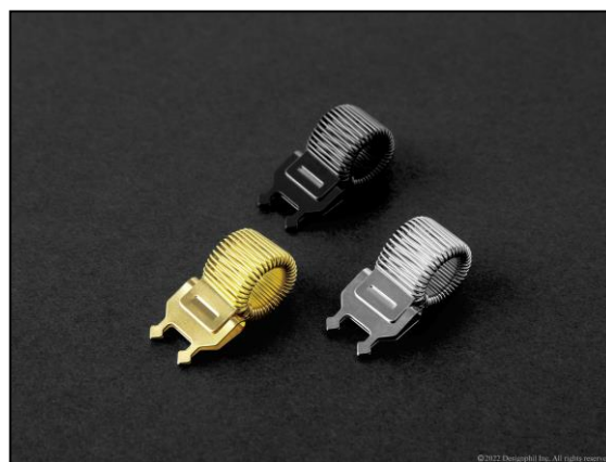
どんなカレンダーにも調和しやすい カラーラインアップ