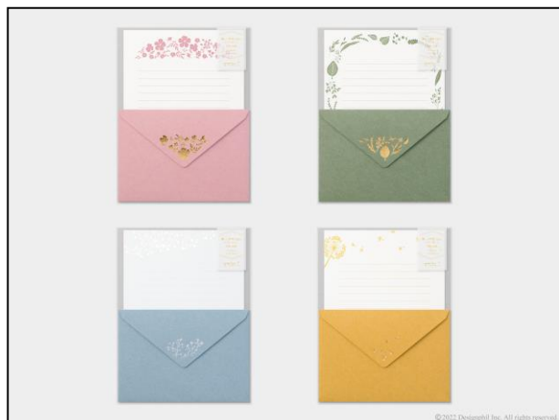
落ち着いた大人の雰囲気を感じる全 4 柄