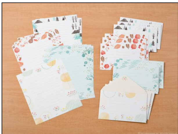
季節の移ろいを楽しみながら使える 『四季のレターセット』