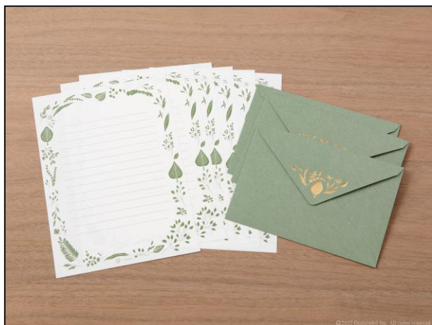
優しい草花のデザインで送る 『箔押し封筒のレターセット』