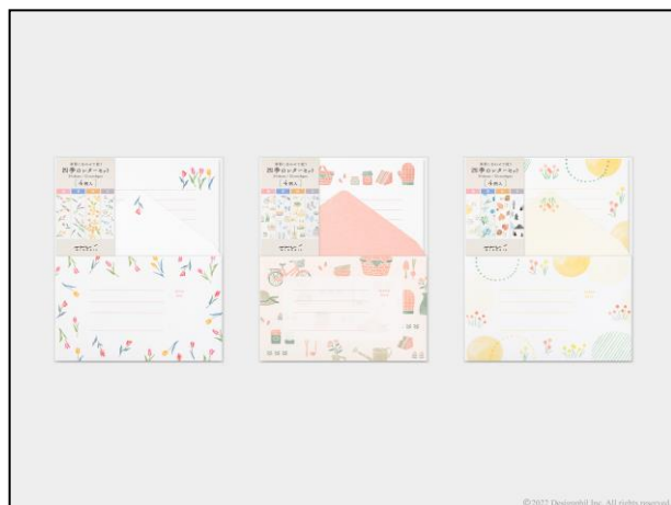
柔らかな色合いの全 3 柄