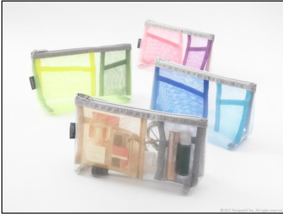
たっぷり収納できるマチ付きタイプ