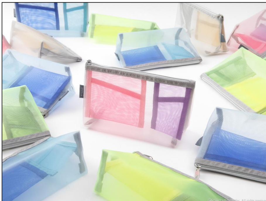
ポケットの色と形で仕分けがしやすいメッシュ素材のポーチ 幅広いシーンで活躍するマチ付きタイプが登場！ 『ペン&ツールポーチ マチ付』新発売