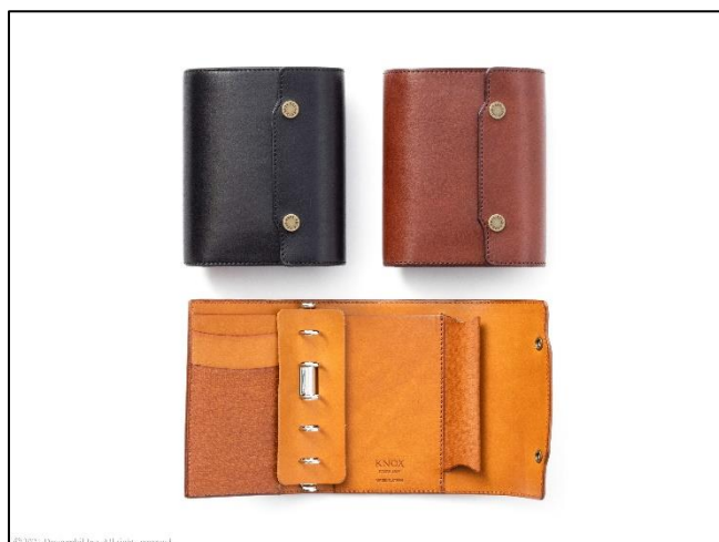
ご要望を多数いただいていたミニ 5 サイズが定番製品に！ クラフトマンシップ溢れる最高級フラッグシップモデル オーセン『システム手帳 ミニ 5 穴サイズ』新発売