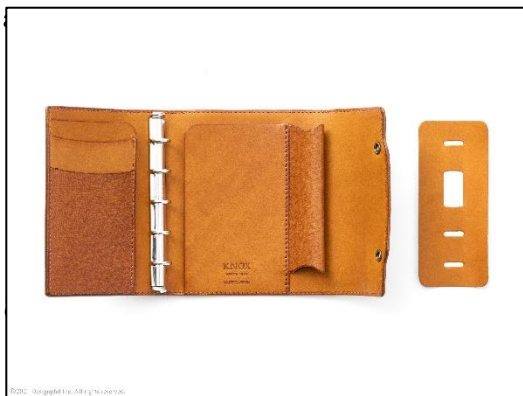
バインダーと同じ革の着脱可能な リングサポーター付き

既存の手帳展開カラー 5 色(ブラック、ブラウン、ダークブラウン、グリーン、ワイン)に加え、ミニ 5 サイズのみレッドを追加しました。全 6 色展開。