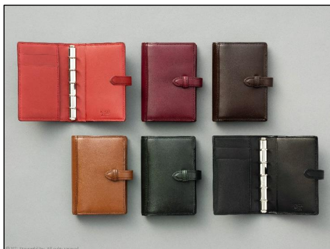
20 年ほど前まで販売していたミニ 5 サイズを復刻！ スタンダードデザインのロングセラーモデル ピアス『システム手帳 ミニ 5 穴サイズ』登場