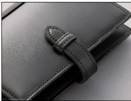
きめ細やかな表情のバッファローカーフが ミニマムな手帳スタイルに映える