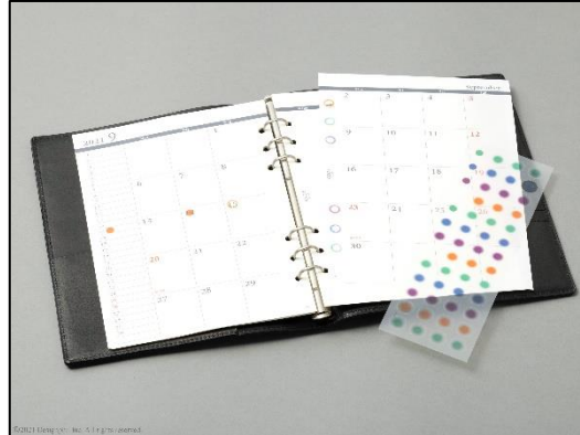
貼りやすいカラー版のリング穴補強シール。シール中央部分は丸シールとしても使えます。