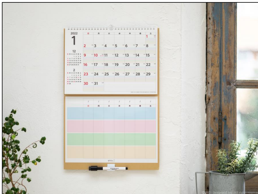
家庭内のコミュニケーションツールとして活躍！ 家族専用ホワイトボード付きカレンダー 2022年度版『ホワイトボードカレンダー<M>家族』