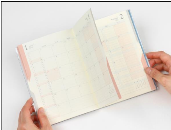
赤(月間ページ)のインデックスを押さえると 赤のページのみが開く