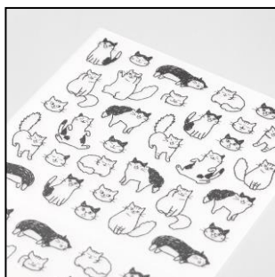
おしゃべり:ネコ柄