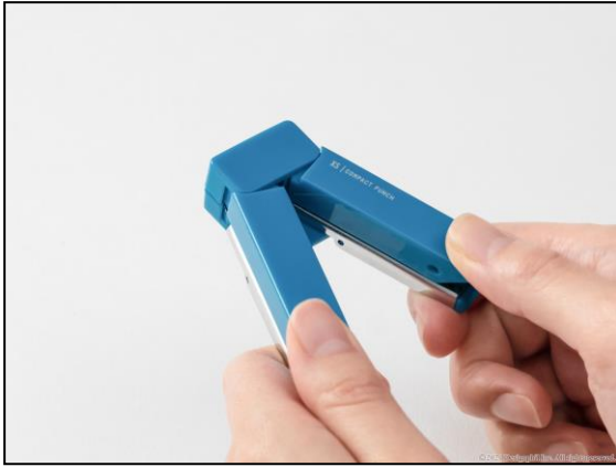
本体を左右に開くだけで自動的に持ち上がり、一度にコピー用紙 5 枚まで穴開け可能