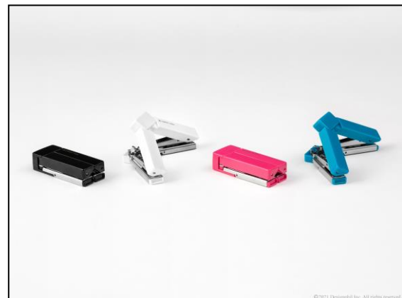
お好みに合わせてお選びいただける黒・白・ピンク・青の 4 色