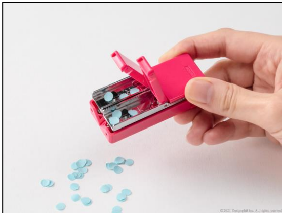
ゴミが散らばらないよう底面には便利なダストトレイ付き