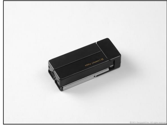
使わないときは手のひらに収まるコンパクトサイズ