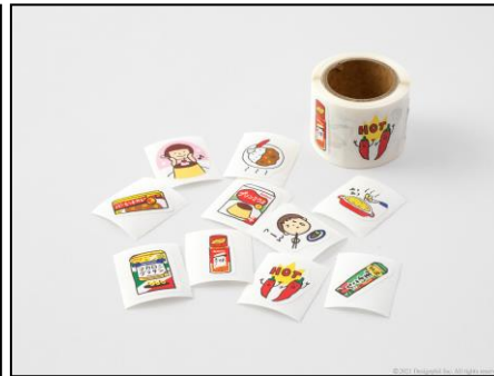
イラストは、実際の製品で使われているもの わさびを食べて鼻がツーンとしている様子など、 遊び心もプラスしたロールシール