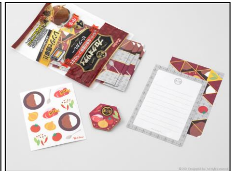
折ったときに盛りつけたカレー皿になるよう、 パズルのように絵を配置したメモ