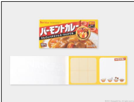
メモにはカレールウを思わせる ミシン目入り