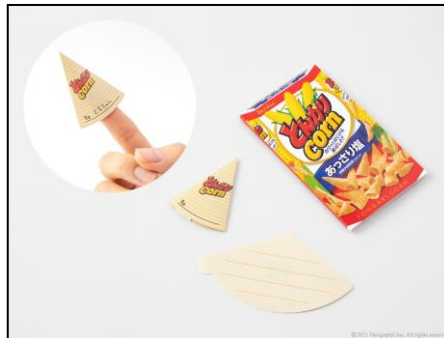
折ったメモは実物の「とんがりコーン」と ほぼ同サイズに仕上げました