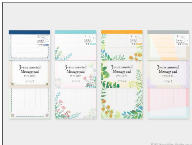
シーンを選ばないデザイン全4柄