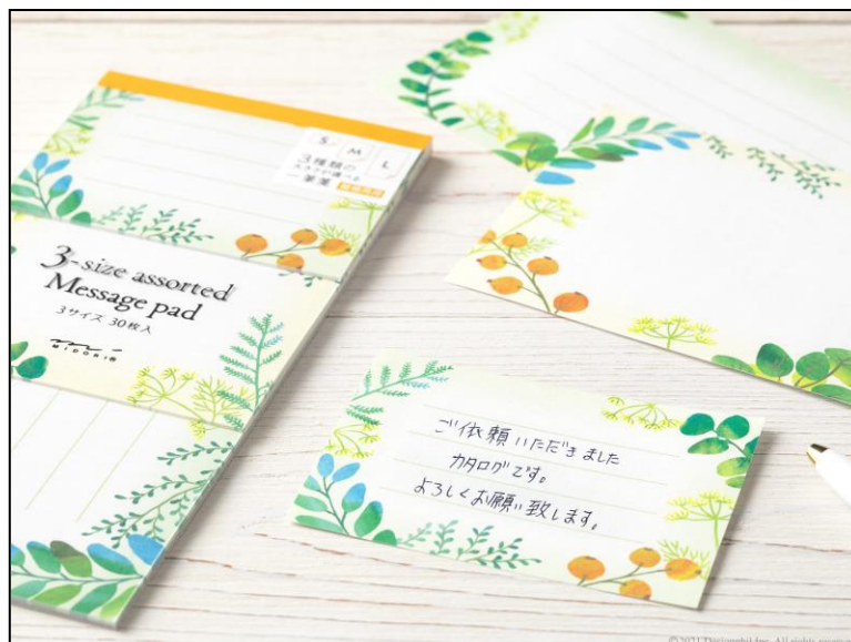
用途や文章量に合わせて使い分け！3つのサイズが1冊に綴られた一筆箋 『3サイズの一筆箋』新発売