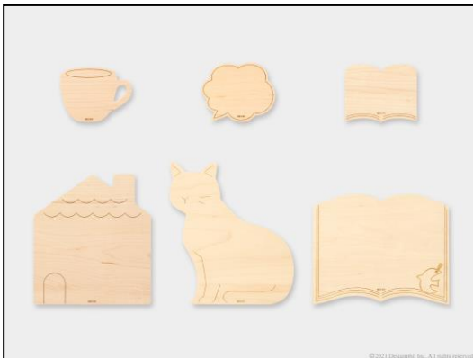
木製素材を生かした、ほっこりするデザイン