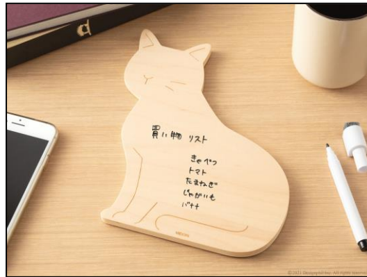
伝言板や備忘録などにおすすめの<M> マグネット付きなので冷蔵庫や玄関にも貼れます