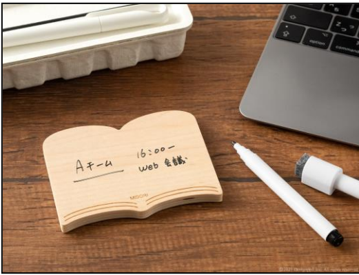
テレワークでのちょっとしたメモにぴったり 付せんサイズの<S>