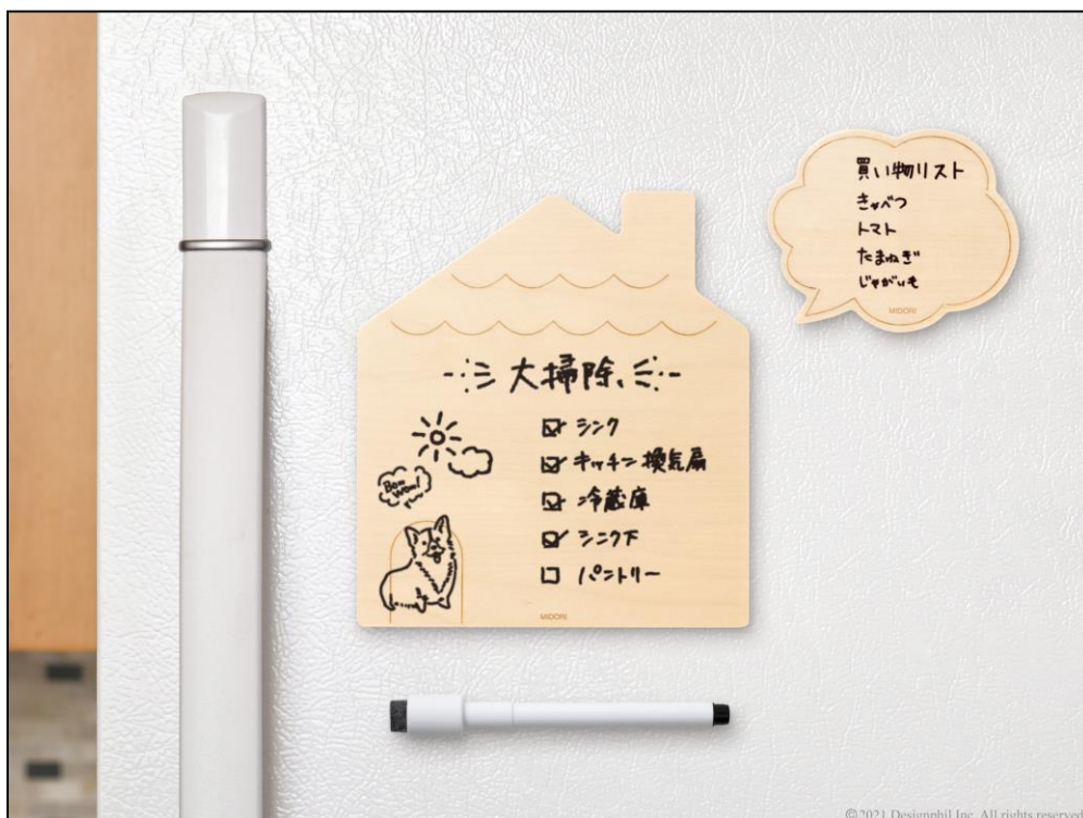
ちょっとしたメモにぴったり。インテリアに馴染む木製ホワイトボード 『木のホワイトボード』新発売