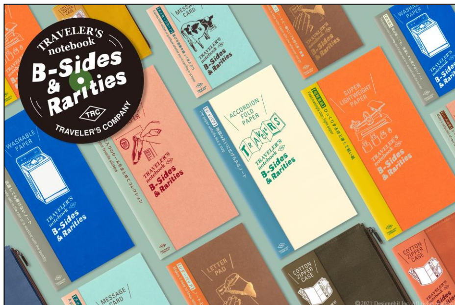
『トラベラーズノート』の楽しみ方を広げる限定リフィル さまざまなアイデアを形にした「B-sides & Rarities」新発売

今回発売する『リフィル』は、ミュージシャンが「B-Sides & Rarities」をリリースするように、ノートには普段あまり用いないような、さまざまな素材を使ったリフィルをご用意しました。