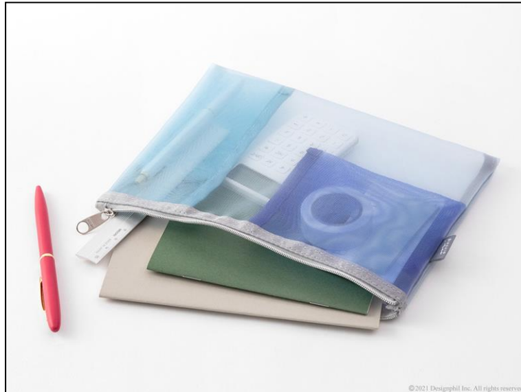
アイテムのサイズに合わせて使い分けができる 便利な2つの内ポケット付き