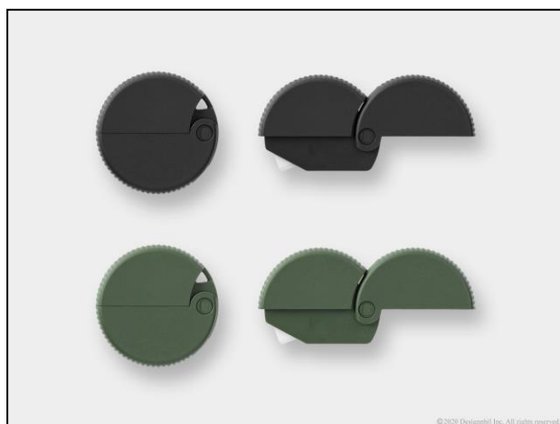
『ダンボールカッター』