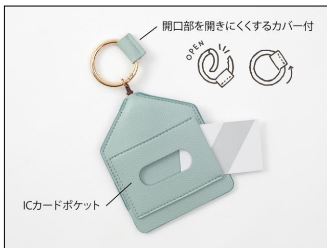
開口部を開きにくくするカバー付 ICカードポケット