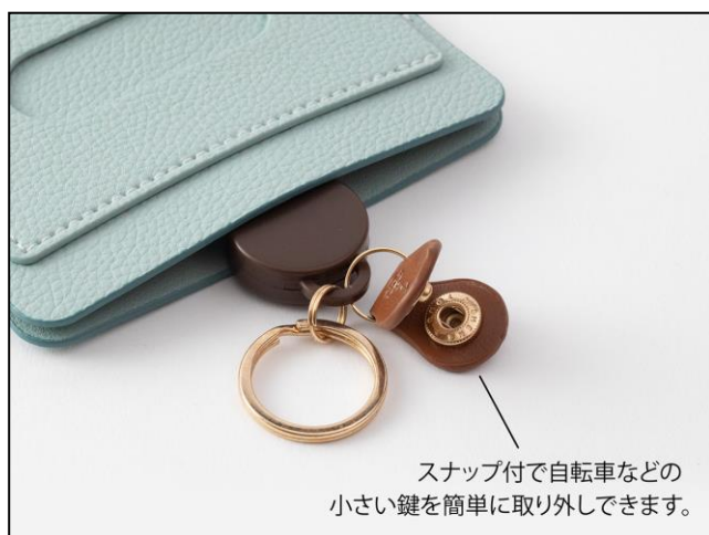
スナップ付で自転車などの小さい鍵を簡単に取り外しできます。