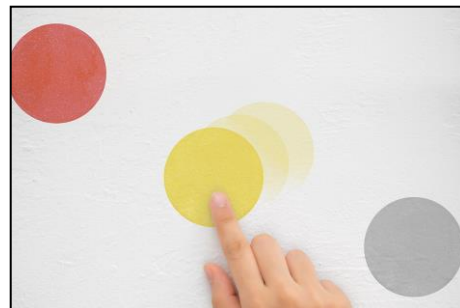
貼ったままステッカーをスライドでき、一度貼った後でも位置調整が簡単