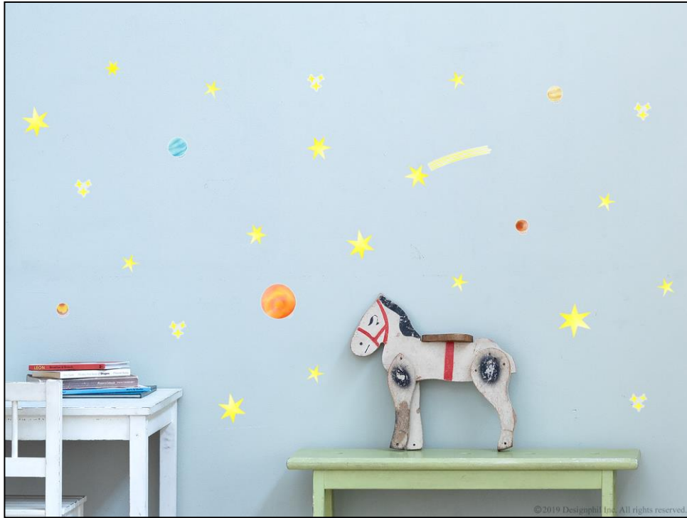
星や月、惑星を柔らかなタッチで表現した「星柄」