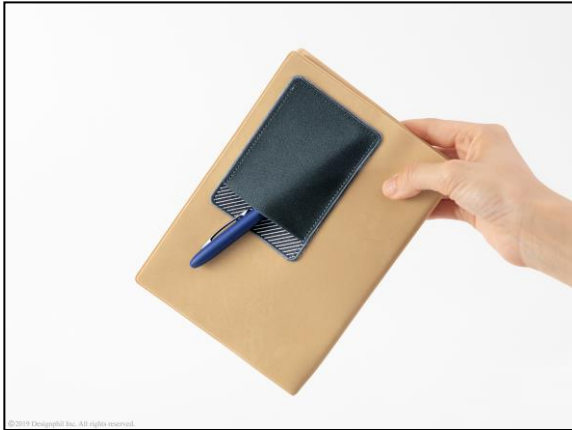
逆さにしても滑り落ちにくく、 バッグなどに入れても安心