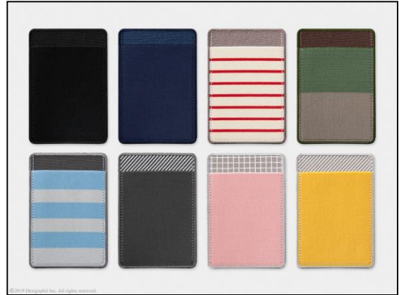
お好みに合わせて選べる 3タイプ8デザイン