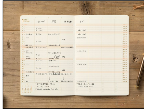
必要最小限にスケジュールを管理。(左)月間 (右)進行