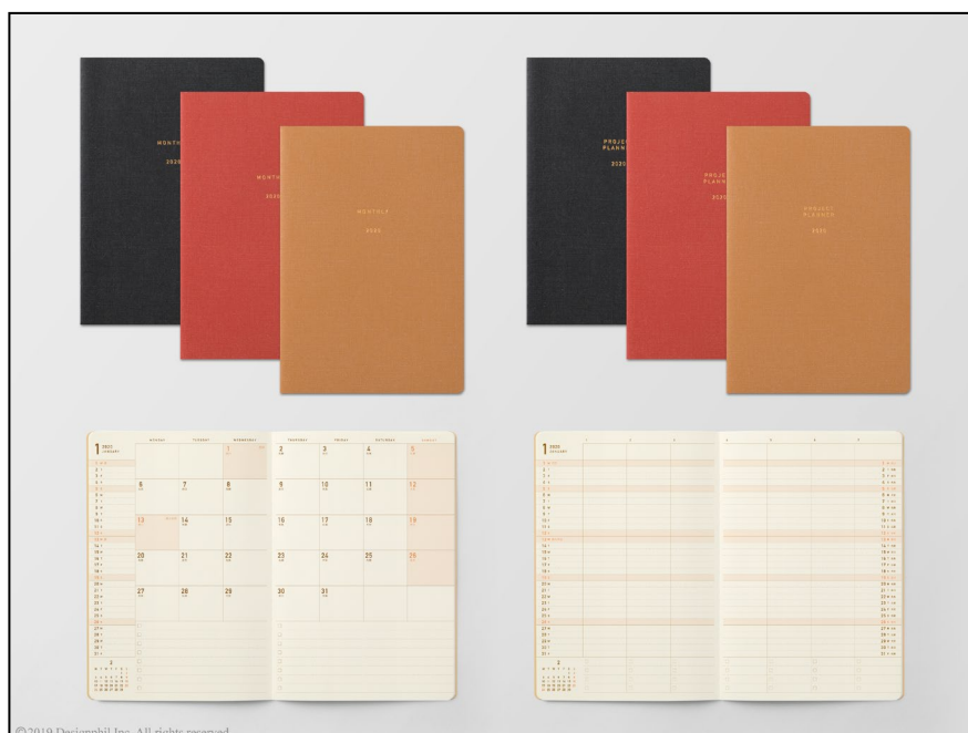
スケジュール管理に必要な最小限の機能を収録したダイアリー 2020年版『ミニマルダイアリー』