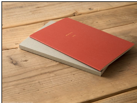
厚さわずか3mmと薄くて軽く持ち運びに便利