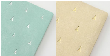
エッフェル塔柄: 水色、ベージュ