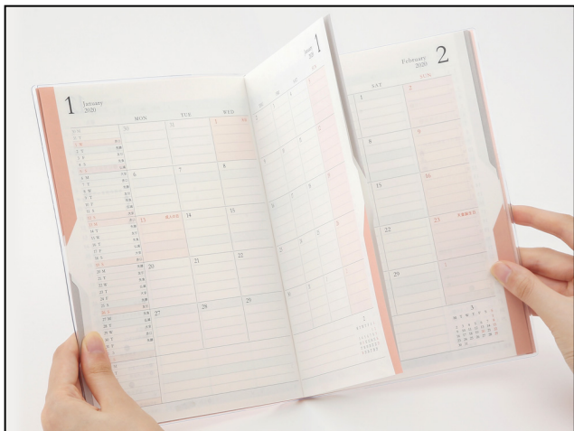
赤のインデックスを押さえると スケジュールページのみが開く