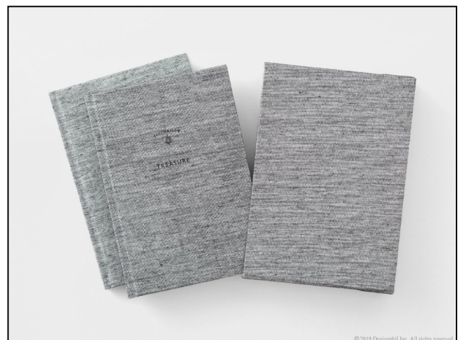
自然な風合いのグレーの織生地が張られた 上製本仕上げの B6 サイズのノート