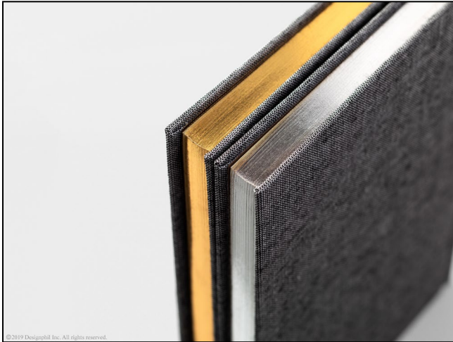
紙を保護し、上品な印象を演出する 三方金付け、銀付け加工