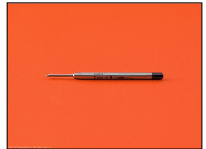
『ボールポイントペン リフィル』