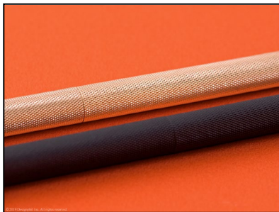
軸全体にロートレット加工を施し、グリップ感とスリップ防止を実現