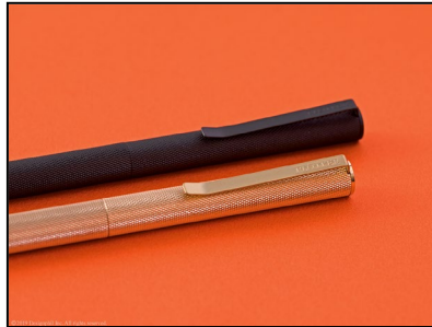
クリップ部分は、レザーバインダーのバックプレートに髭鬚させるデザインに