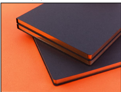
側面にコッパー色の箔を施し、高級感を演出