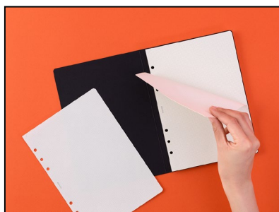
必要な分だけ切り離して収納できる 2/3