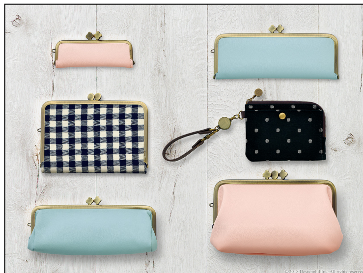
大人の女性のためのシンプルで機能的な小物アイテム 「小物雑貨」シリーズの新製品発売！