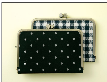
兵庫県播州織(ばんしゅうおり)のコットン生地 の風合いが魅力の「チェック柄」「ドット柄」