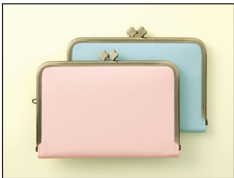
落ち着いたパステルカラーの「ピンク」「水色」。 汚れや水に強いポリウレタン(合成皮革)素材なので安心