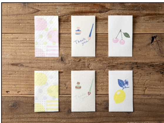
手紙や小物などを贈るときにも活躍する 『活版ぼち袋<S>』