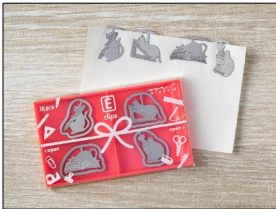
ケースにリボンをかけたようなパッケージがかわいい 『エッチングクリップス 文具ネコ柄』