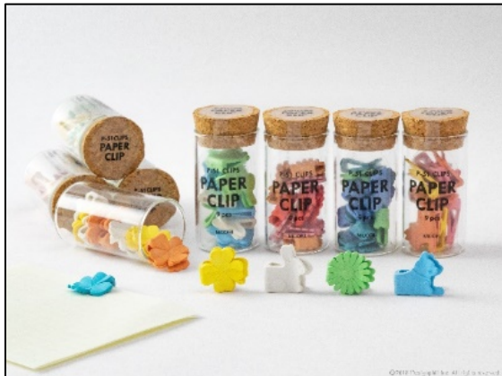
人気柄をボトルに詰めた、コレクションしたくなる 『ボトル入りP-51 クリップス』