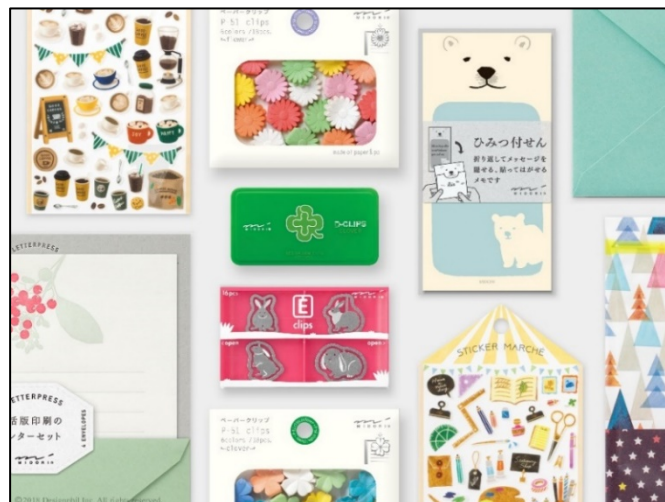
「ミドリ」の人気アイテムが大集合！文具女子博 2018 出展