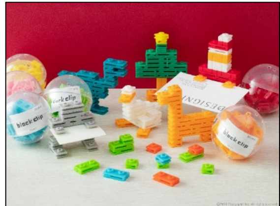
アイデア次第でいろいろな形に組み立てられる 『カプセル入りブロッククリップ』