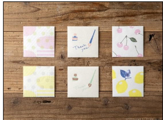
お札を1回折りたたむだけでびったり入る 『活版ぼち袋<M>』