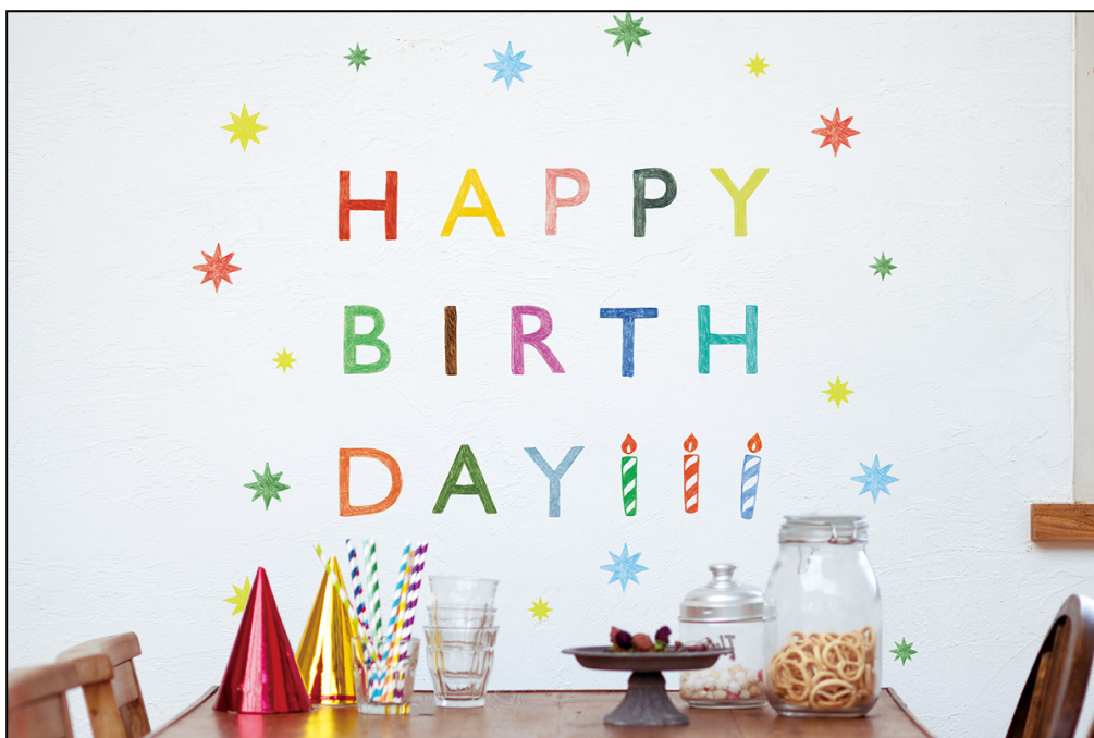
静電気でぴたっと貼り付く新感覚のインテリア用ステッカー 『ウォールステッカー』新発売！

どの柄もあたたかみのあるデザインで使いやすく、柄を絞ってすっきりまとめたり、複数の柄を組み合わせるとより華やかにしたりと、お好みに合わせてデコレーションを楽しめます。誕生日会やホームパーティーの演出、インテリアのアクセント、お部屋のフォトスペースをデコレーションするなど、さまざまなシーンで活躍するアイテムです。