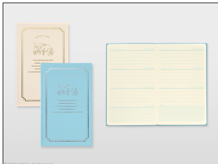
すき間時間に書ける小さな育児日記 『スキマ日記 育児』新登場