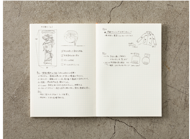
文字や図形、メモ、イラストなど、さまざまな使い方をサポートする5mm方眼罫のメモページ