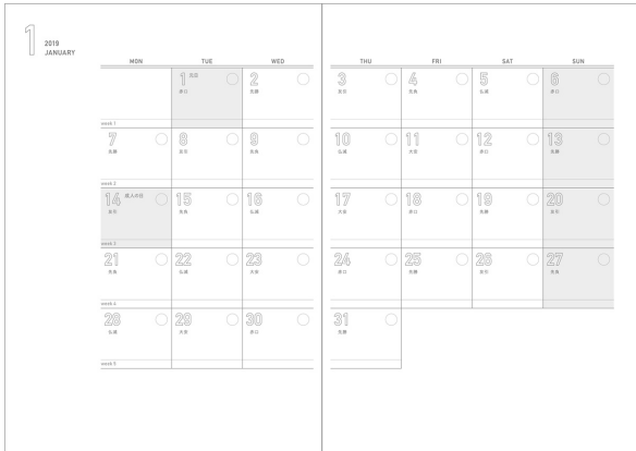
自分好みに彩れるようシンプルなフォーマットを採用