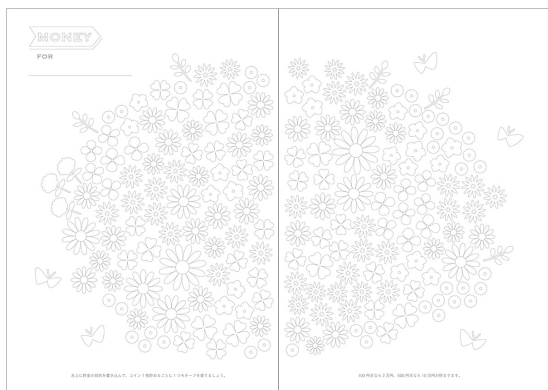
付録には、貯金額や読みたい本、見た映画などを記録するページを収録