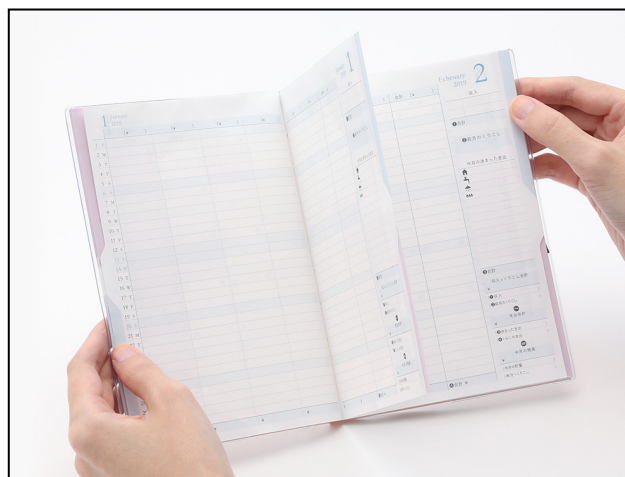
青のインデックスを押さえると 家計簿ページのみが開く