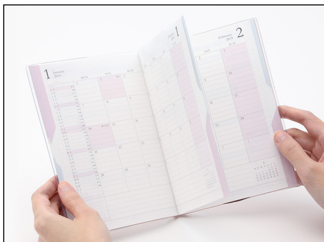
赤のインデックスを押さえると スケジュールページのみが開く