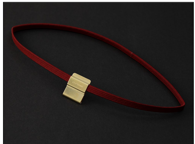
手帳やノートの裏表紙に固定できるクリップ付き