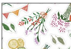
ドライフラワー柄