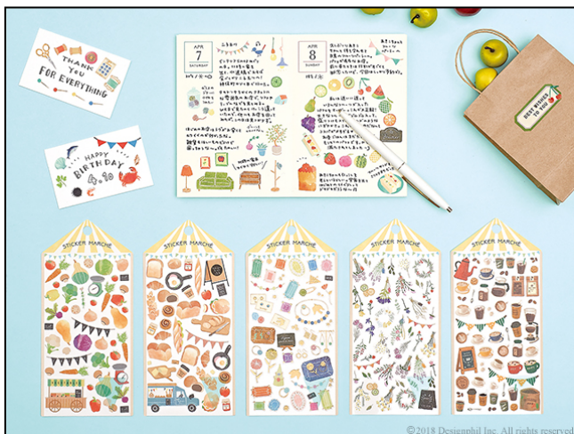
食べ物や雑貨、花など、楽しくにぎやかなマルシェをイメージした『シール マルシェ』