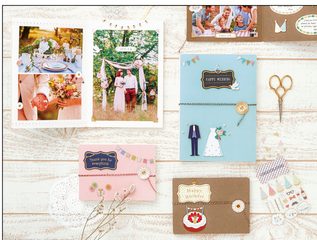
人生の大切な記念日を彩る「ペーパークラフト ミュージアム」に 新アイテム『タイトルシール』登場！