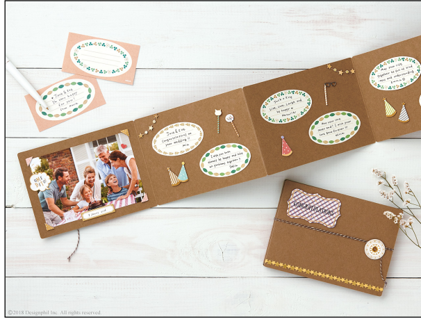
ギフトやアルバム、色紙などに使えるラベルシール 『メッセージラベル』に「グリーン柄」が仲間入り！