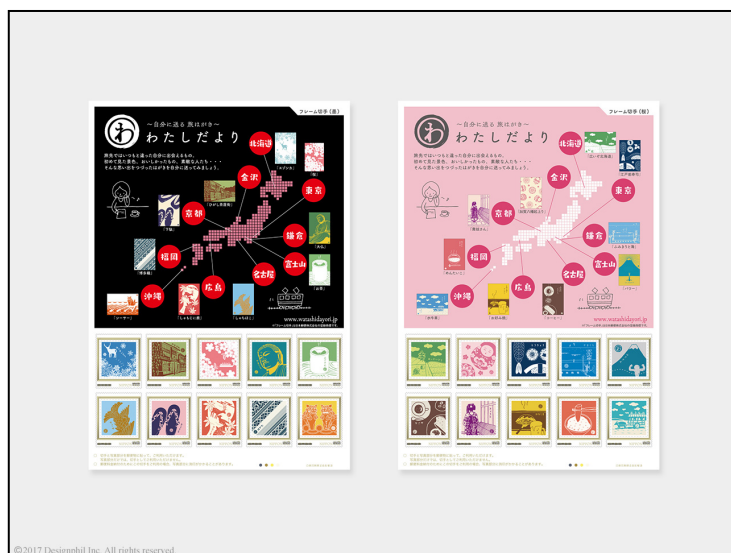
一周年記念！各地のモチーフが切手になりました。

展開中の『はがき』の中から、キリッとしたデザインを集めた「墨」と、ほっこりしたデザインを集めた「桜」の2柄をご用意しました。各地を巡り、「わたしだより」の『はがき』と、切手や風景印を組み合わせ手紙を出したり、届いた手紙を『アルバム』に収納したりと、手紙を送る/届く楽しみを体験していただけます。