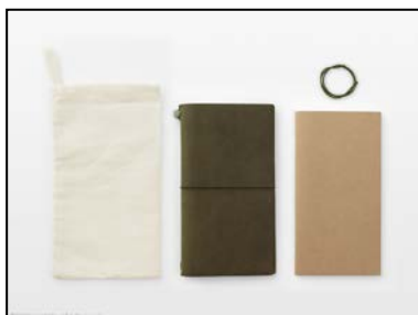
『トラベラーズノート オリーブエディション』

オリーブカラーに塗装した『プラス ボールペン』で、ひもとフックパーツが付いています。ひもの長さを調整し、首にかけたり、バッグに結び付けたりすれば、アウトドアや旅などにも便利に持ち歩くことができます。また、クリップを取り外して使うこともできます。