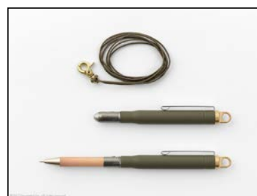
『プラス ボールペン オリーブエディション』