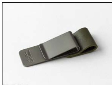
『ペンホルダー<M> オリーブエディション』