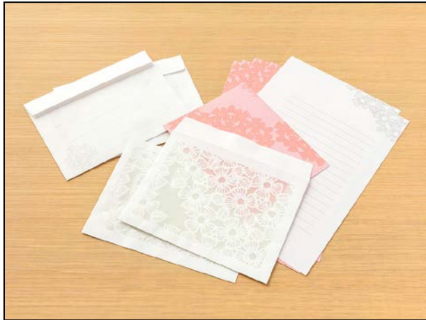
横罫線入りの便箋 8 枚と封筒 4 枚が セットになっています。