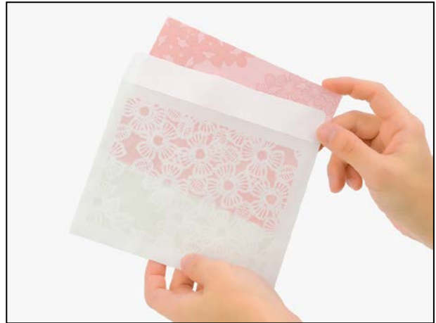
二つ折りにした便箋を入れると絵柄が美しく透けます。