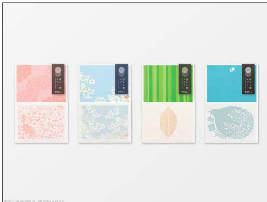
封筒に透かしの加工が入ったレターセット『透かし窓レター』新発売！