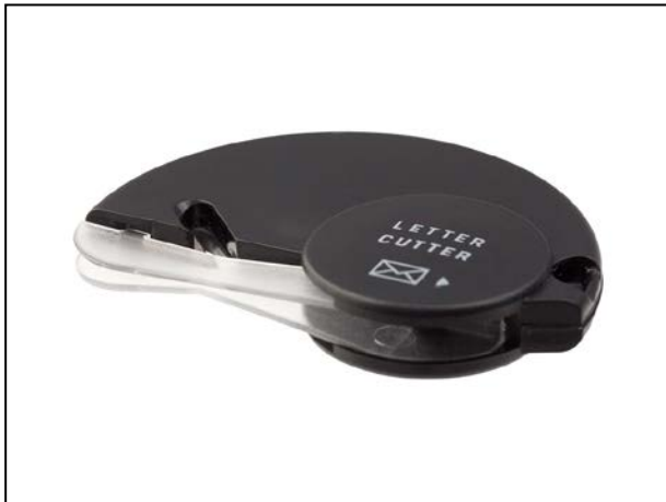
カッターの刃が外に出ていない安全設計。