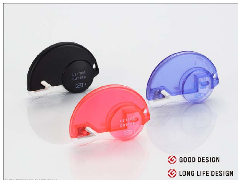
大切な封書をきれいに開封できる『レターカッター』