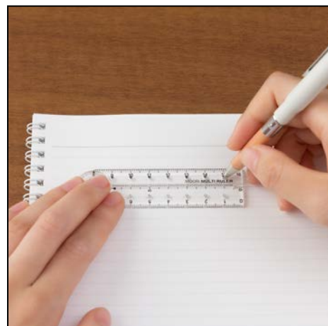
目盛り穴付き 1センチごとに穴が空いていて、罫線などを描くときの目印としても便利です。 ※<16cm><30cm>のみ