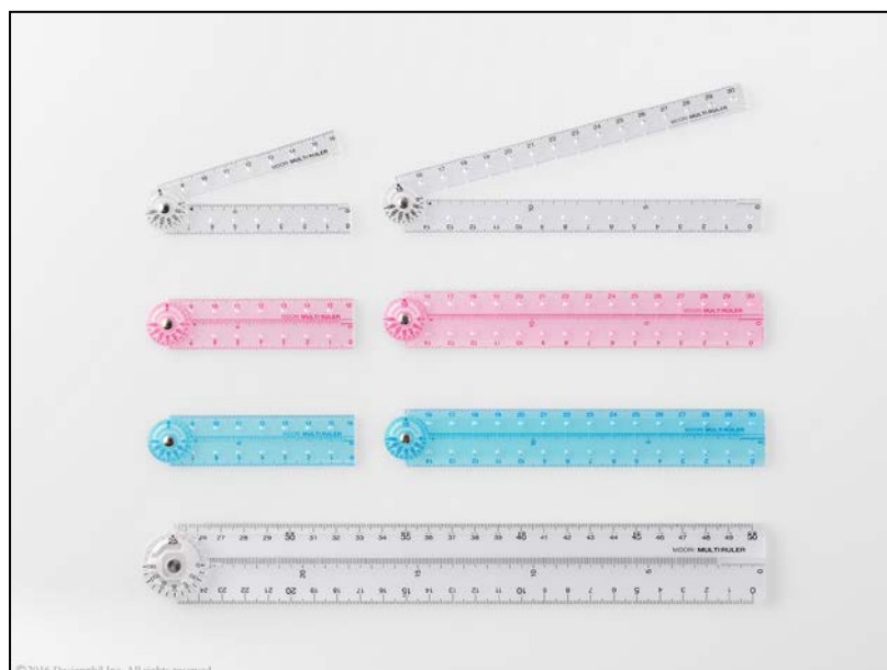
15年のロングセラーアイテム！ 折りたためる定規『マルチ定規』がリニューアル