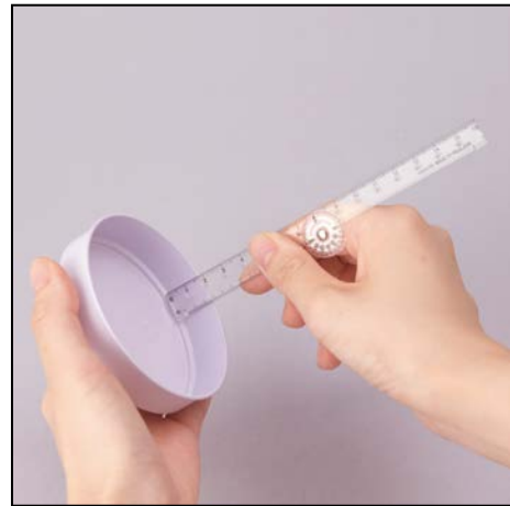
高さや奥行き計測 高さや奥行きが測りやすいグランドポイント目盛り付きです。