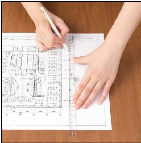
開くと2倍のサイズの直定規 水平に開いたときに継ぎ目で引っ掛かることなく、スムーズに直線を引けます。 ※<50cm>は、紙がズレない滑り止め付き