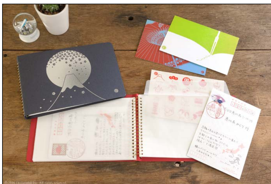
郵便局限定販売 『わたしだより』～自分へ送る 旅はがき～

今回発売する製品は、全国共通柄と各地域のモチーフをデザインした各局限定柄の「ポストカード」、はがきや切手を収納し、持ち歩きに便利なファイル「おたよりケース」、届いたはがきをストックし、旅の思い出がたくさんつまった自分だけの旅アルバムが作れる「おたよりアルバム」の3種類です。