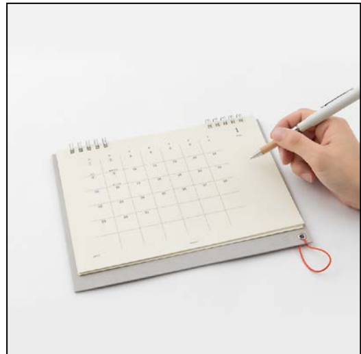
たたむと書き込みやすいフラットな状態に