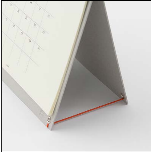
ひも1本のシンプルなスタンド