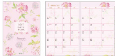
カントリータイム 花柄